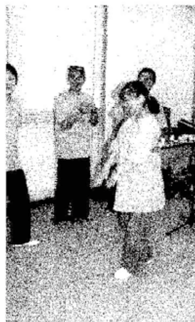
太極拳演武の前のひとコマ おそろいのTシャツを着て